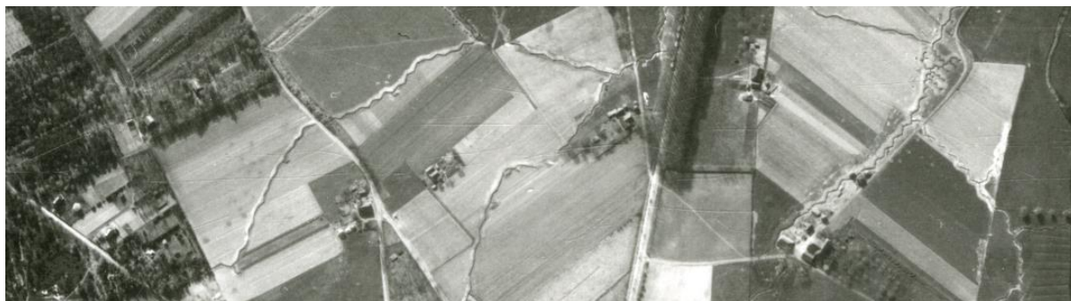
Uitsnede van een luchtfoto waarop loopgraven zichtbaar zijn.

De beleidskaart geeft aan of er wel of geen archeologisch onderzoek vanuit de overheid noodzakelijk is.